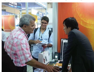
現場交流洽商開拓合作商機